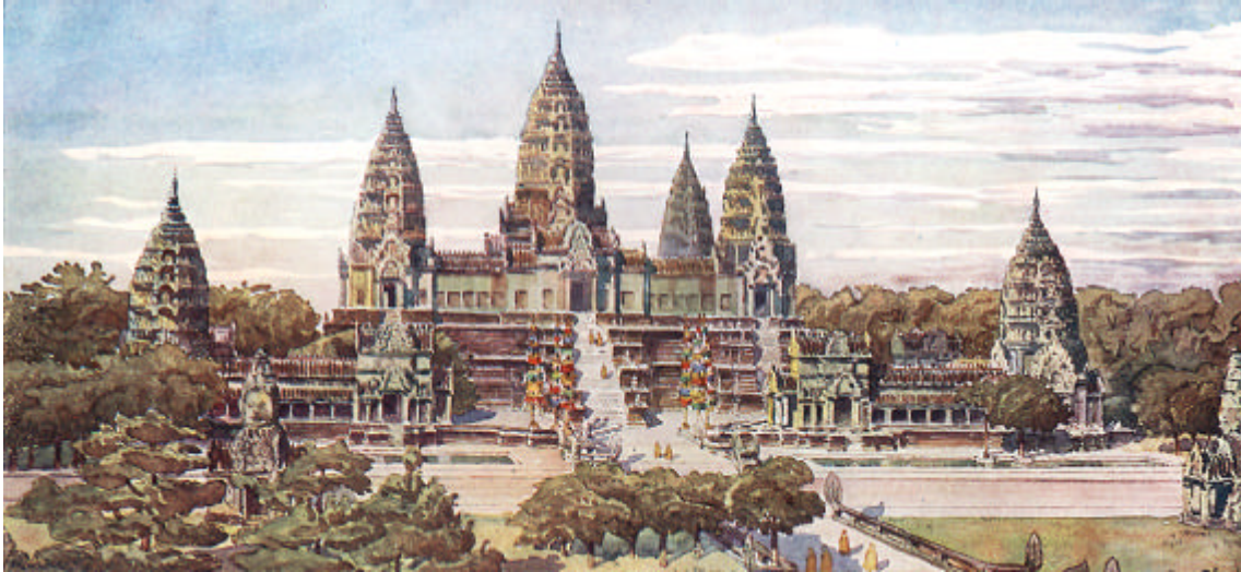
Vue d'ensemble du palais d'Angkor, « L'exposition coloniale », album hors-série, L'Illustration , mai 1931.