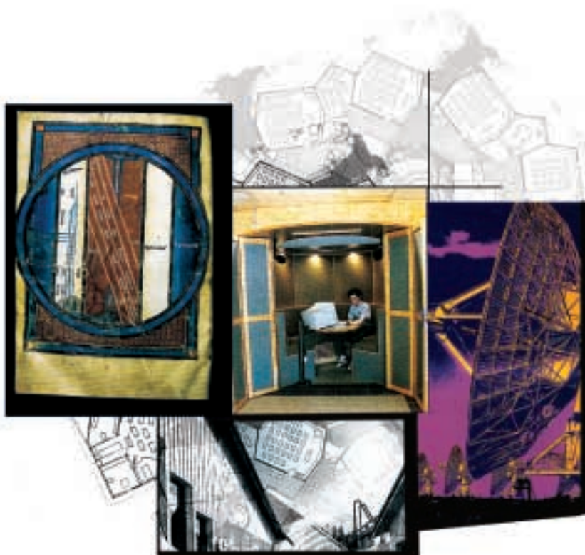
Des premières cartes aux cartes informatisées.

Et pourtant, tout est situé quelque part et la géographie n'a jamais eu autant d'importance. Ainsi, le seul développement des sites de vente en ligne a déclenché un regain des livraisons à domicile. Pour aider les livreurs à trouver les adresses,