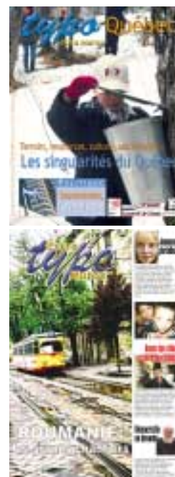
Vietnam, Québec et Roumanie, les trois hors-série de Typo Extra Muros .