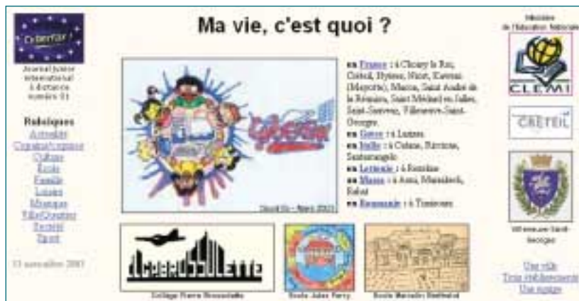
Le numéro 31 de cyberfax! , réalisé en mars 2003 par les élèves de Villeneuve-Saint-Georges, et le numéro 2 de la série, en 1997, consacré à l'Antiquité. Cette première expérience est à l'origine du Méditerranéen .