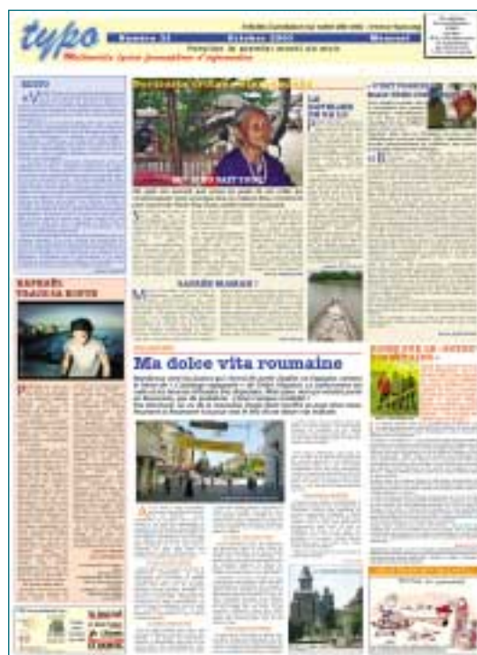
Une page du Journal de Saône-et-Loire

Mais cette parole, pour avoir un sens, devait être lue. Très vite, l'enseignant et les deux anciens « journalistes scolaires » initiateurs de Typo ont compris qu'une diffusion de masse ne pouvait passer que par la forme imprimée. Le Web, bien