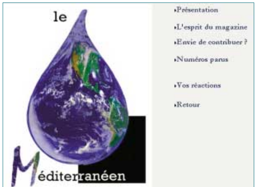
Page d'accueil du Méditerranéen sur le site académique d'Aix-Marseille.

écrire sur la Toile s'est banalisé, les propositions sont très nombreuses, et l'on a peu de chances de recruter des adeptes si l'on ne s'insère pas dans un cadre connu et éprouvé (programmes du Clémi, Histoires croisées franco-québécoises, programmes européens, etc.).