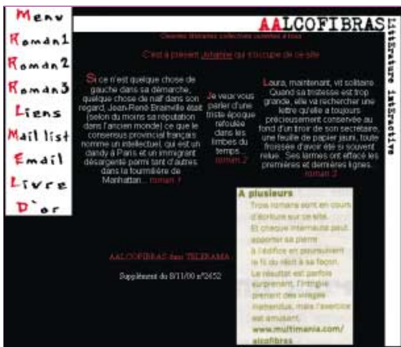
Alcofibras , http://membres.lycos.fr/alcofibras/index3.htm

Cette pratique d'écriture à plusieurs mains intéresse depuis le début des internautes qui trouvent là une façon de s'exprimer et de laisser libre cours à leur imaginaire tout en s'intégrant dans un cadre qui est moins vécu comme une contrainte que comme un espace de jeu et de rencontre des autres auteurs. Certains sites sont devenus de véritables références, tel Alcofibras qui propose l'écriture de trois romans différents (un