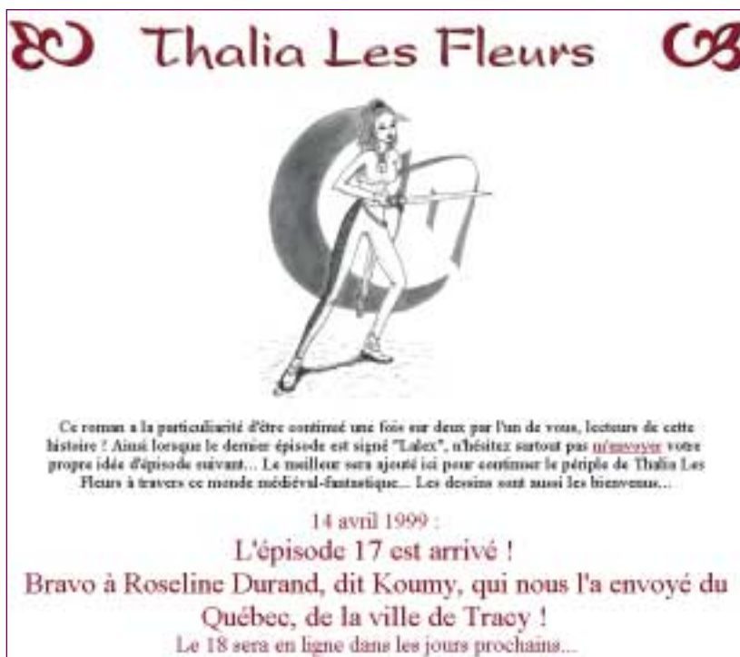
Thalia les Fleurs http://membres.lycos.fr/thalialesfleurs/

« C'est très simple, vous lisez, vous ruminez, et vous proposez une suite. »