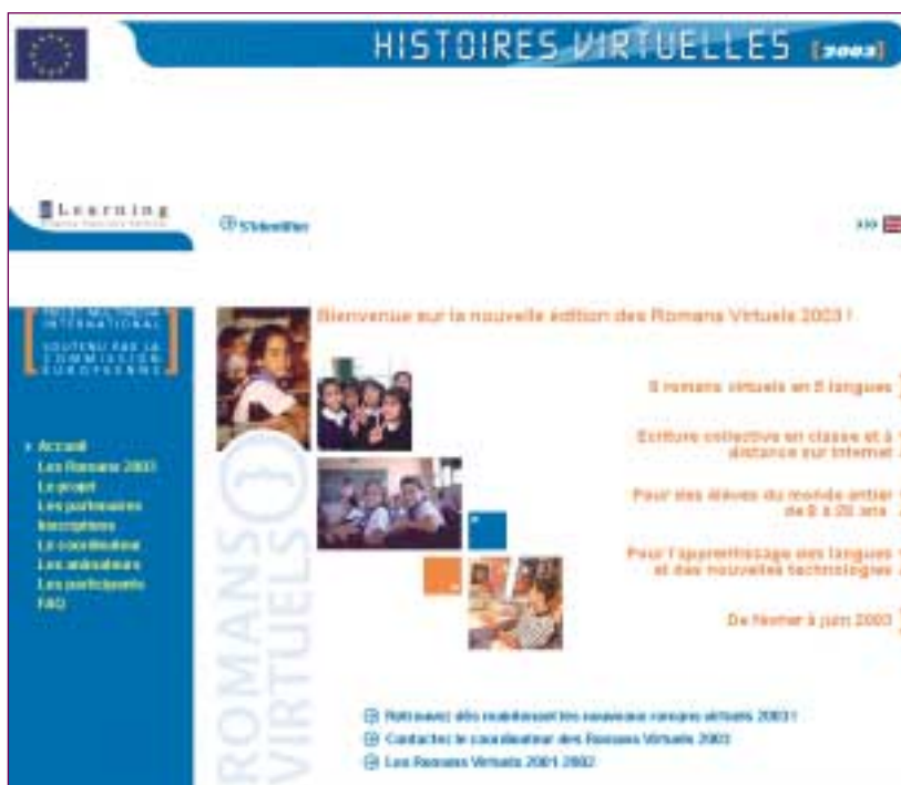
Romans virtuels , http://www.romans-virtuels.com