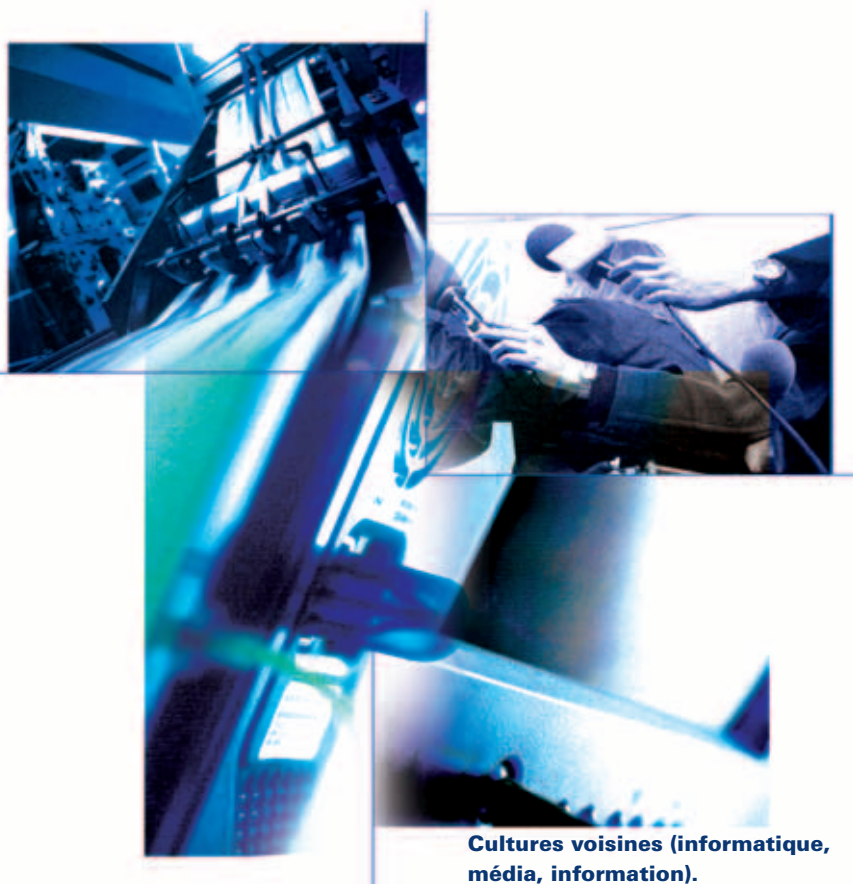
Cultures voisines (informatique, média, information).

– pour l'enseignement supérieur : les projets Forsic (1999) de l'Urfist de Toulouse 2 , Métafor (2002) de l'Urfist de Rennes 3 , un projet (resté inachevé) du réseau des Urfist de construire une ontologie de la maîtrise de l'information (2004) 4 ; le référentiel Erudist du SCD de Grenoble 5 ; la réflexion sur les contenus de formation dans plusieurs SCD 6 ; plus récemment, le travail entrepris par Formist pour recenser les contenus de formation pour les étudiants avancés (niveau master et doctorat) 7 ;