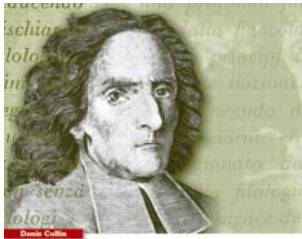
Giambattista Vico et l'histoire