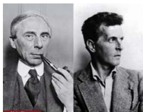
Russell-Wittgenstein La vérité et la logique