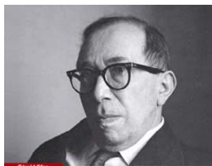
Leo Strauss et le problème de l'interprétation

En matière d'interprétation, la pensée de Leo Strauss fait figure de modèle. Elle propose un discours de la méthode mis en œuvre dans la lecture de grands textes philosophiques de la tradition antique et moderne. Elle nous permet de mieux répondre à deux questions centrales : à quelles conditions une interprétation peut-elle être tenue pour rigoureuse et légitime ? Quelles sont, mesurées à l'aune de cette exigence rationnelle, les alternatives fondamentales entre les grandes orientations de l'art d'interpréter et quels en sont les enjeux ?